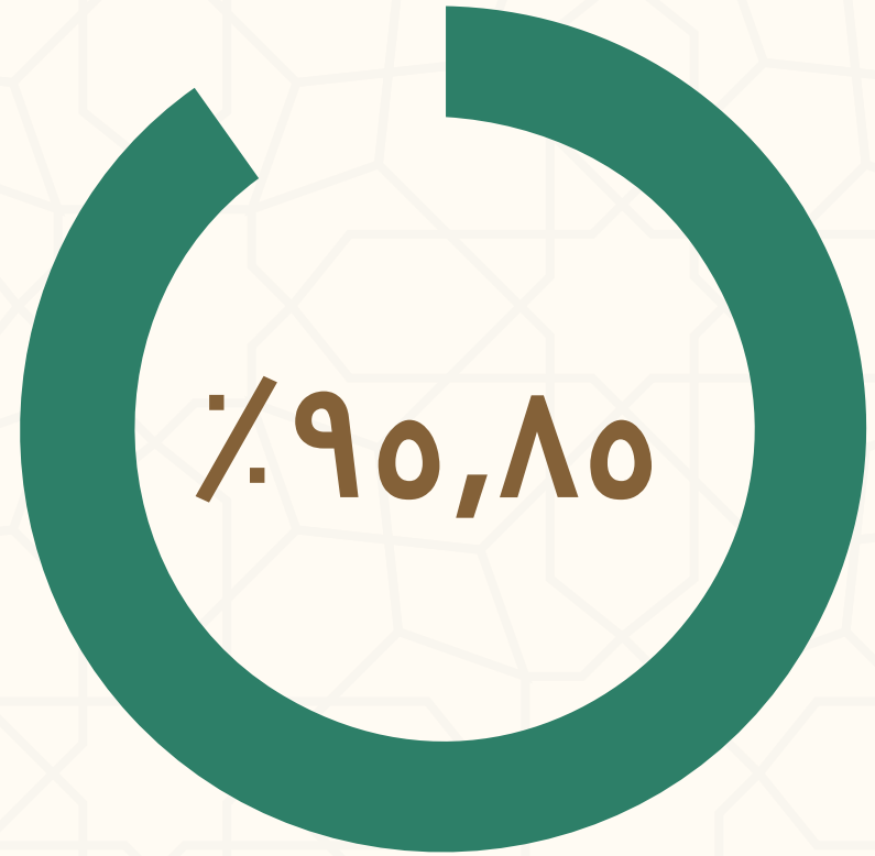
نسبة رضا المستفيدات